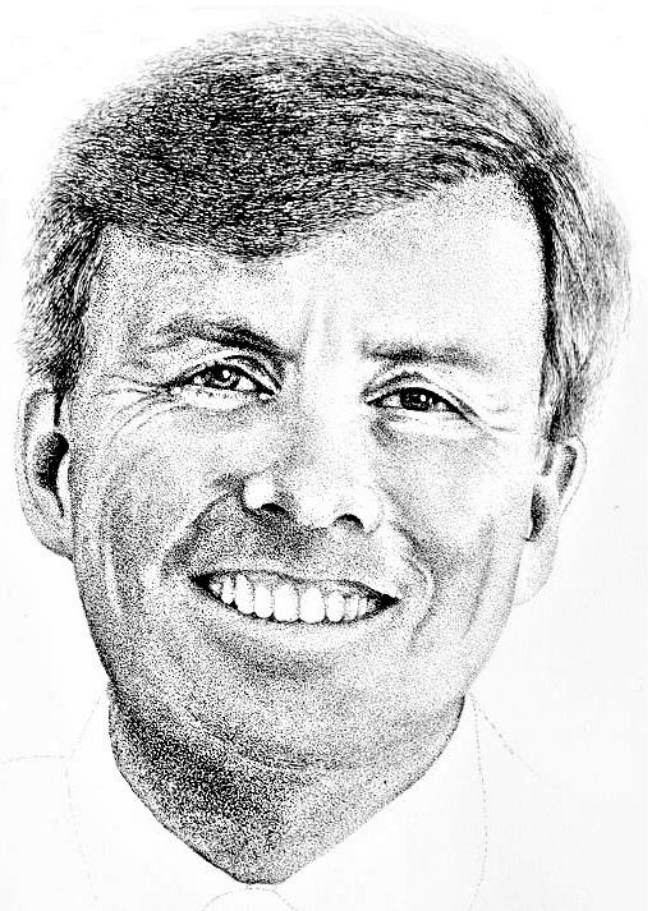
Willem Alexander, koning van Nederland